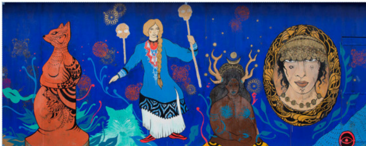
Quand la direction du patrimoine et de l'architecture « embellit le cadre de vie » de la Goutte d'Or ( Work in progress, octobre 2017 ). Agrandir l'image .

Un temps dit « de concertation » devra donc être instauré, idéalement dans le but de prévenir tout recours postérieur à l'instruction et à l'octroi des autorisations d'urbanisme. Un mouvement civique s'est en effet développé récemment dans la Goutte d'Or. Aux côtés d'une pétition réunissant 250 commerçants soutenus par une vingtaine d'associations ou institutions (parmi lesquelles la Cohérie Boris Vian, Paris-Goutte d'Or et Cavé Goutte d'Or), une pétition d'habitants signée par 1.800 personnes en quelques semaines a identifié, entre autres, les « erreurs historiques dans l'aménagement et la gestion du quartier, notamment depuis l'opération de réhabilitation urbaine des années 1980 », et estimé qu'il était « urgent de corriger le tir ». Les deux pétitions ont été remises aux autorités municipales et étatiques le 27 mars 2018 et le mouvement ne cesse de s'étendre autour de ce qui peut être qualifié de réappropriation de l'espace public par les habitants et les commerçants du quartier.