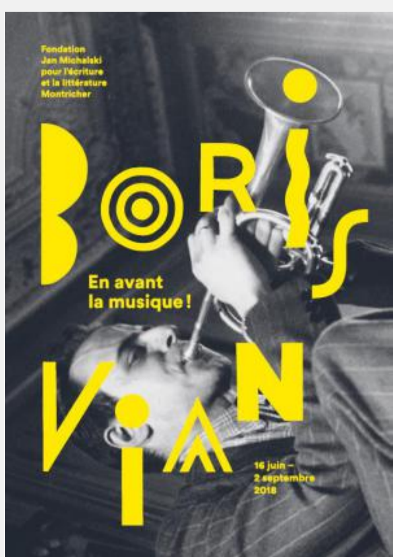
L'exposition Boris Vian /En avant la musique ! du 16 juin au 2 septembre 2018 à la Fondation Jan Michalski.

L'idée d'une seconde réunion dans six mois (donc fin novembre 2018) est également actée. Comme en écho à la double rencontre annuelle instaurée par Cavé Goutte d'Or les 2 mai (Saint Boris) et 30 novembre (date anniversaire de l'arrêté municipal donnant son nom à la rue Boris Vian), le Secrétariat général de la Ville de Paris et la Cohérie Boris Vian s'apprêtent ainsi à entrer dans un processus de suivi dont Cavé Goutte d'Or a proposé en mars dernier qu'il soit réapproprié par les habitants du quartier, elle-même passant le témoin comme l'explique son programme 2018 :