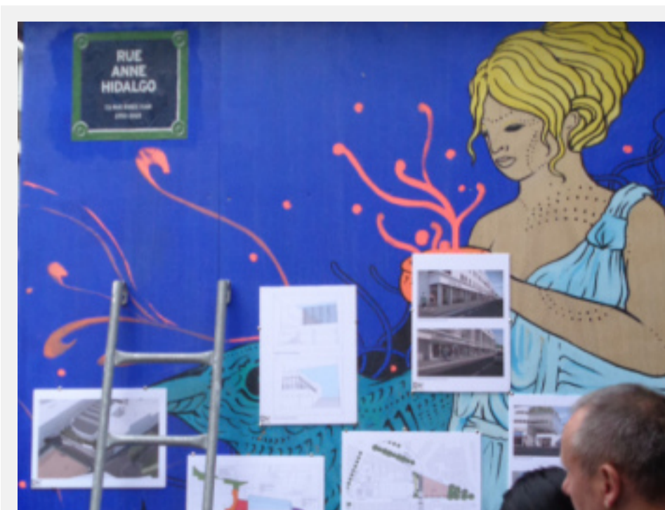
Quand les embellissements de la direction du patrimoine et de l'architecture servent de support à la réappropriation de l'espace public par les habitants ( Reportage « C'était hier », 3 mai 2018 ).