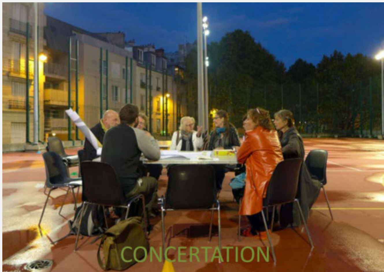
Sur le TEP Goutte d'Or/Boris Vian, travail sous la pluie le 6 octobre 2015. De gauche à droite : l'équipe d'architectes, Cavé Goutte d'Or, Action Barbès, Les Enfants de la Goutte d'Or, les EDL, la direction de l'Urbanisme la Cohérie Boris Vian ( notre billet : Chemins de traverse ).