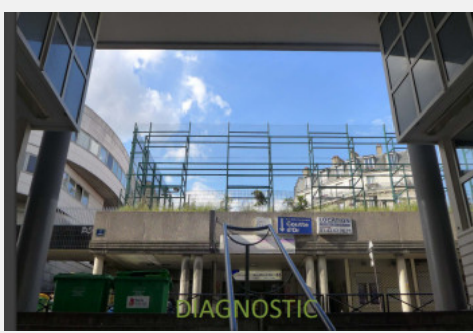
La 24 mai 2018 à l'aube, à l'emplacement exact du mot DIAGNOSTIC sur le projet 2016, la SAEMES expulse ses locataires de box.